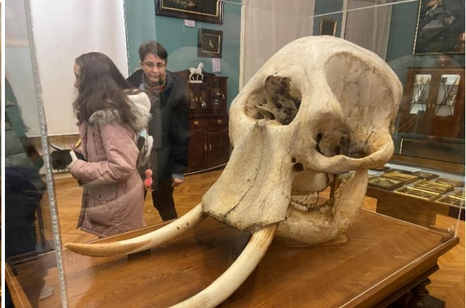
Cabinetul de curiozități